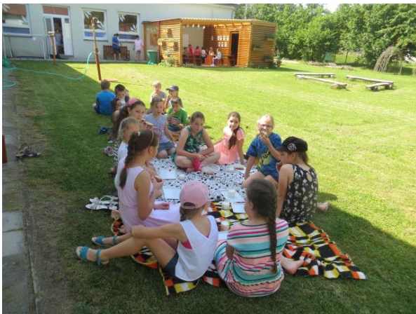
svačinka na školní zahradě