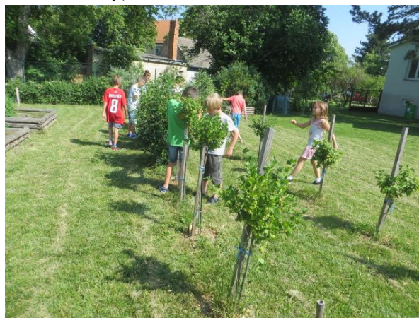
zdravá svačinka- ochutnávka angreštů, rybízu,...