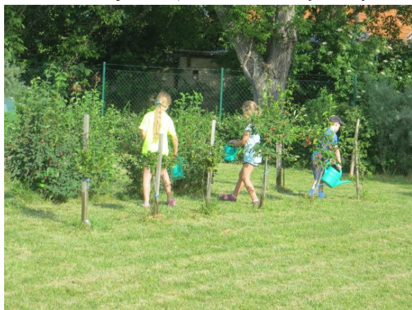
zalévání školní zahrady

V souladu se zákonem č. 106/1999 o svobodném přístupu k informacím bude výroční zpráva sloužit i k nahlédnutí veřejnosti (webové stránky školy, hlavní chodba školy)