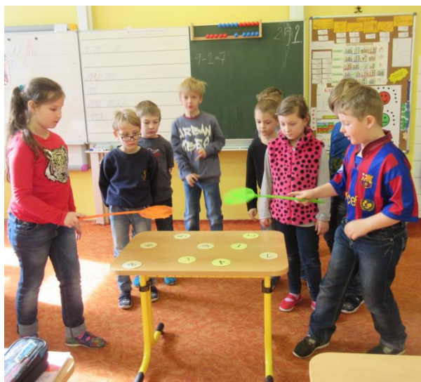
opakování matematiky hrou formou