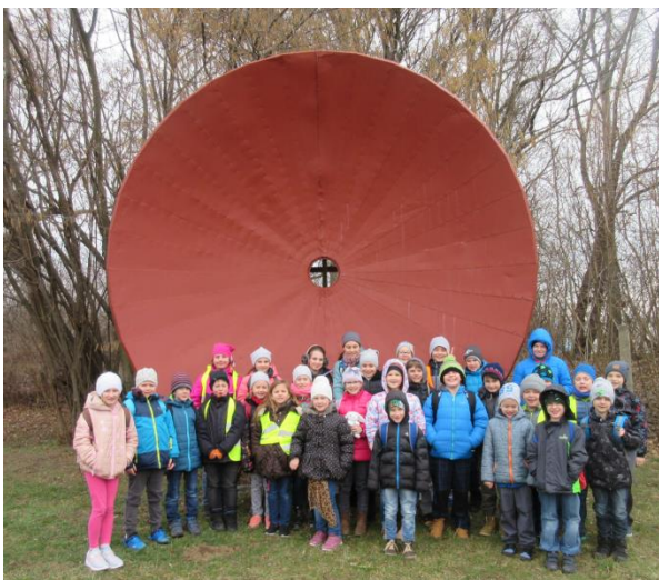
návštěva hvězdárny ve Veselá nad Moravou