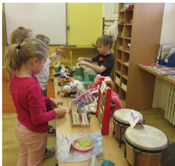
činnostní učení v matematice